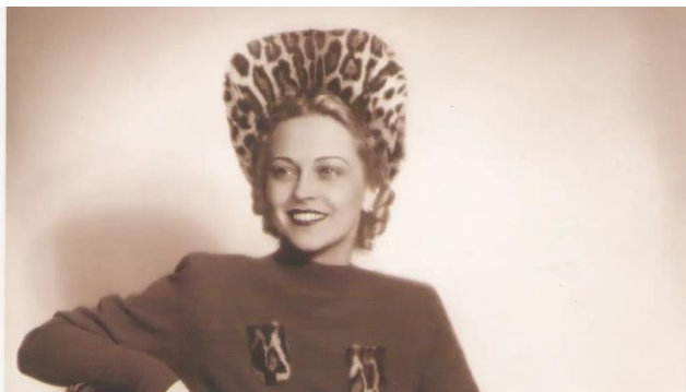
Foto: Zita Kabátová v roce 1941

Pravdivost své rady herečka Zita Kabátová svým životem bohatě potvrdila. V duševní svěžesti a pohodě se dožila takřka sta let.